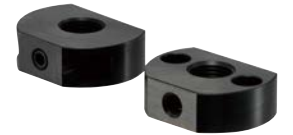
PXVS-BK 细牙螺纹、带锁定螺母 PXVS-C-BK 粗牙螺纹、带锁定螺母

安装时请使用专用的安装夹具 PXV-W PXV-Z (→ P.xxxx) PIXH-Z (→ P.xxxx)。